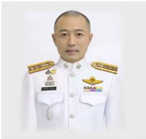
พ.ต.อ.เมฆนท นาขวัณ

ประจำปีงบประมาณ 2567 ของ สถาบันตำรวจภูธรไทยน้อย